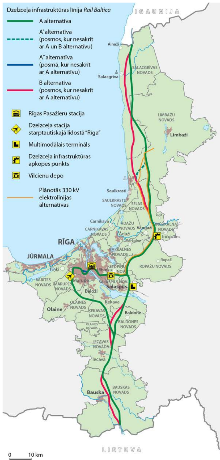
1. attēls. Dzelzceļa infrastruktūras līnijas Rail Baltica alternatīvas.